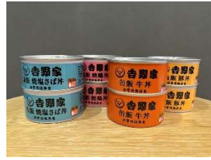
缶飯シリーズ (牛丼・豚丼・焼鳥丼・焼き塩さば丼)