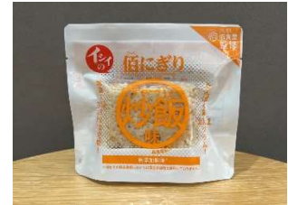
イシイのほにぎり (ステーキ丼味・炒飯味)

その他：アルファ米、牛そぼろご飯、おでん、たこ焼き、だし巻きたまご、常温保存ミートボール、常温保存チキンハンバーグ、リゾット(トマト・コーン)