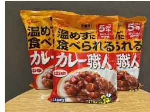
温めずに食べられる カレー職人