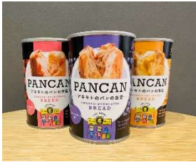
パンの缶詰 PANCAN (ストロベリー・ブルーベリー・オレンジ)